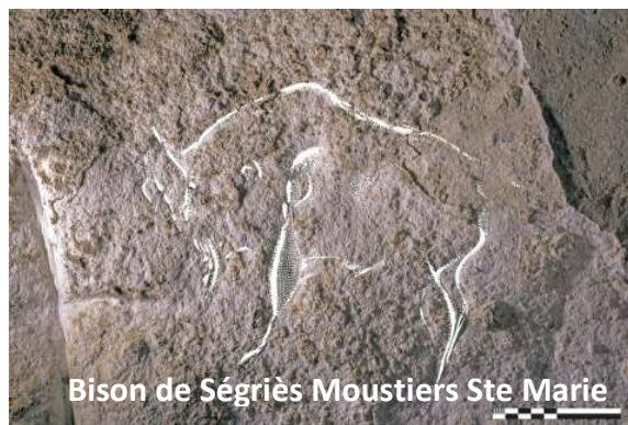
Bison de Ségriès Moustiers Ste Marie