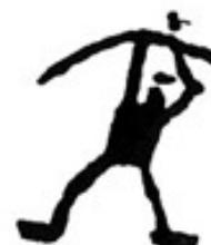
Forme humaine – Mont Bego

De la grotte Cosquer à la Vallée des Merveilles